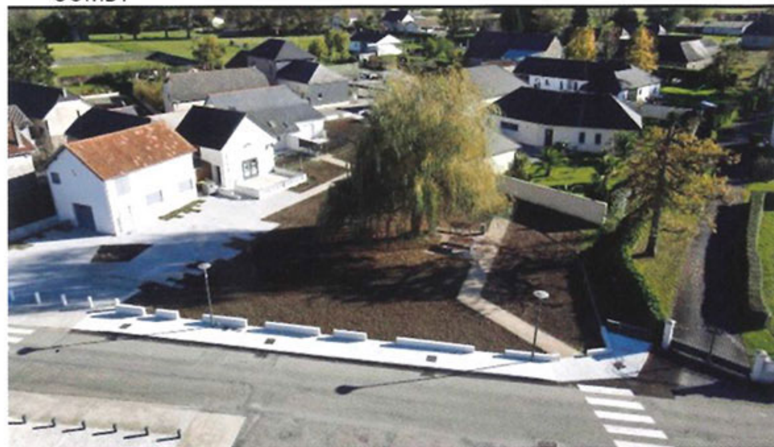
Vue aérienne du jardin achevé