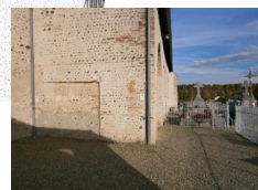
AVANT / APRES

Notre volonté à vos côtés : - reconcevoir votre cimetière pour améliorer son esthétique et faciliter son entretien, - aménager un espace accessible à tous, notamment celles d'accessibilité pour les Personnes à Mobilité Réduite.